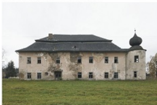
Châteaux po naszymu