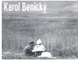
Świat oczami fotografa