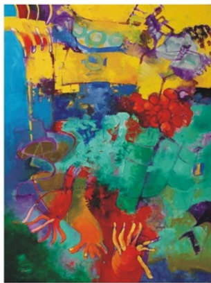
Vladimír Petřík, Sterowiec, akryl, 2009