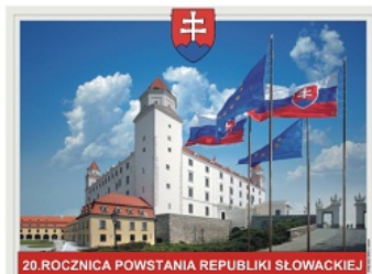
20. ROCZNICA POWSTANIA REPUBLIKI SŁOWACKIEJ