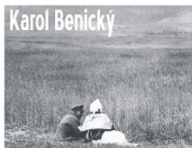
Świat oczami fotografa