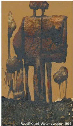
Rudolf Krivoš, Figury v krajine, 1963