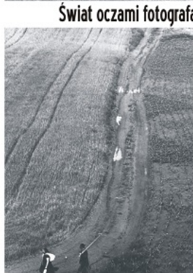
Świat oczami fotografa